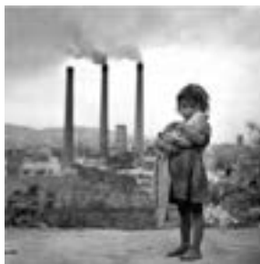
Francesc Català-Roca. Gitanilla , 2002 (1950). Gelatinobromuro de plata virado al selenio sobre papel.