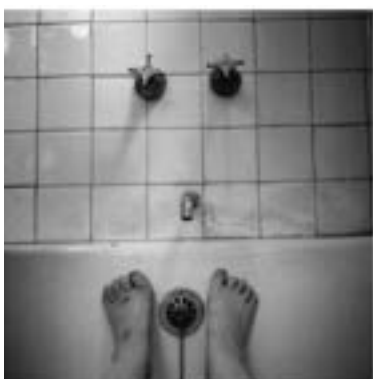
Graciela Iturbide. El baño de Frida Kahlo. Coyoacán, Ciudad de México, 2006