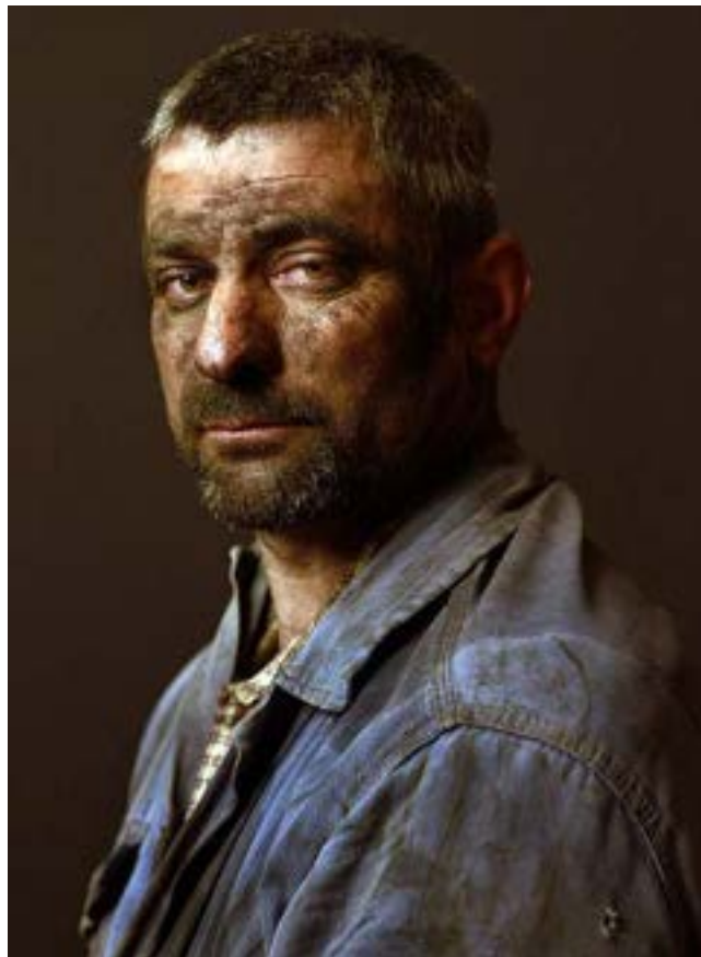
Pierre Gonnord Luis Serie "Terre de Personne", 2009 Impresión de tintas pigmentadas sobre dibond

El Protocolo de Kioto (1997), el Acuerdo de París (2015), el Pacto Verde Europeo (2019) y de nuevo en la Conferencia de Glasgow (2021), casi doscientos países acordaron medidas para contener el calentamiento global, mitigar el cambio climático y reducir emisiones contaminantes. Entre ellas, el compromiso de no abrir nuevas centrales eléctricas que funcionen con carbón.