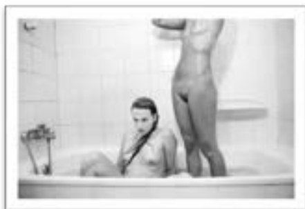
Mar Sáez. Vera y Victoria #31 . Serie "Vera y Victoria", 2015. Impresión de tintas pigmentadas sobre papel estucado de calidad artística.