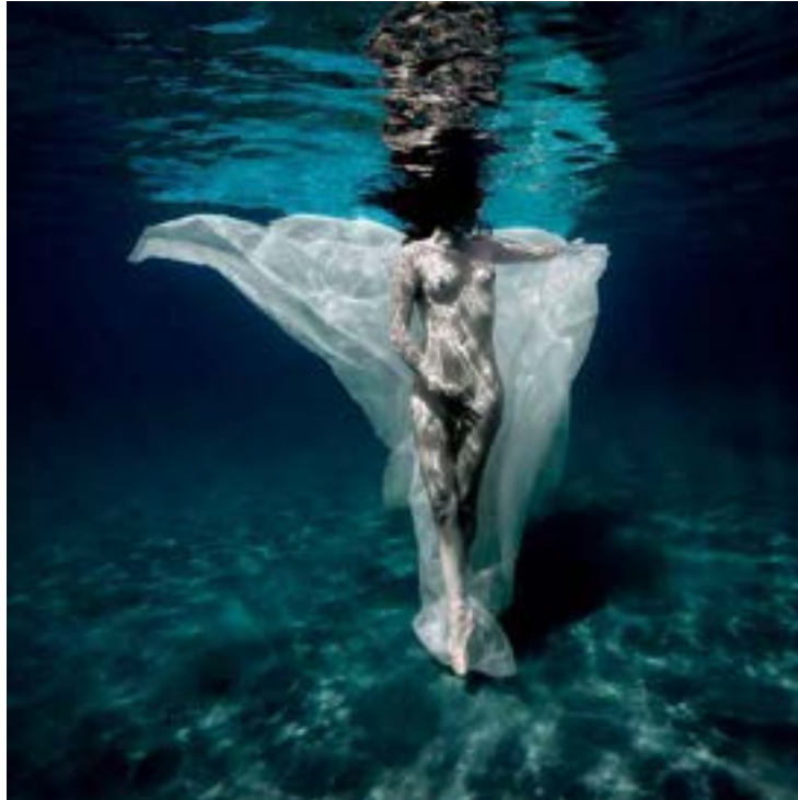
Isabel Muñoz. Sin título. Serie Bajo el agua, 2017. Impresión de tintas pigmentadas sobre papel baritado. Ministerio de Transición Ecológica y Reto Demográfico

La naturaleza es una fuente inagotable de energía: el agua, el viento, el sol, el calor de la tierra, y otras fuentes alternativas ya están en marcha. Desde los años 80 en España se ha ido promoviendo el uso de energías renovables, pero es en los últimos años cuando se ha hecho realidad su incidencia y puede considerarse líder en la transición verde.