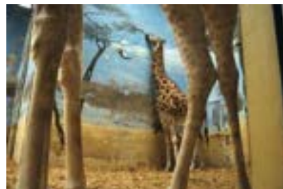
Rebeca Norris-Webb. Paris, Rhymes , 2000. Serie "Slant", 2000. Fuji Crystal archive paper (Type C paper).