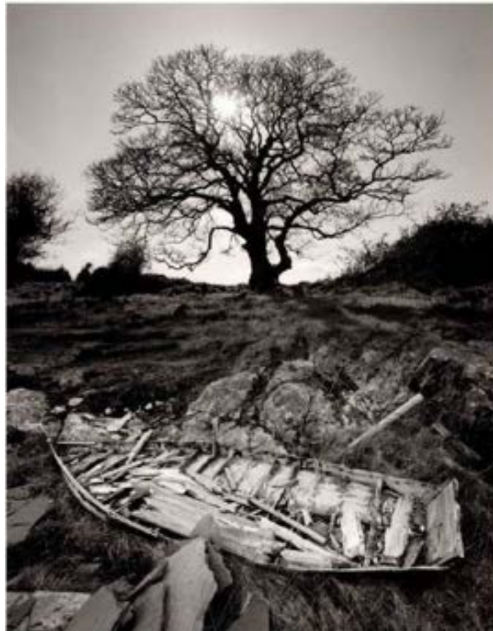
Jerry Uelsmann. Sin título, 2002. Gelatina de plata sobre papel

La conciencia ecológica no solo implica un respeto por el medio ambiente sino por el planeta y todas las formas de vida que lo habitamos.