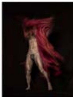
Isabel Muñoz. Sin título. Serie "Japón", 2018. Impresión de tintas pigmentadas sobre papel baritado