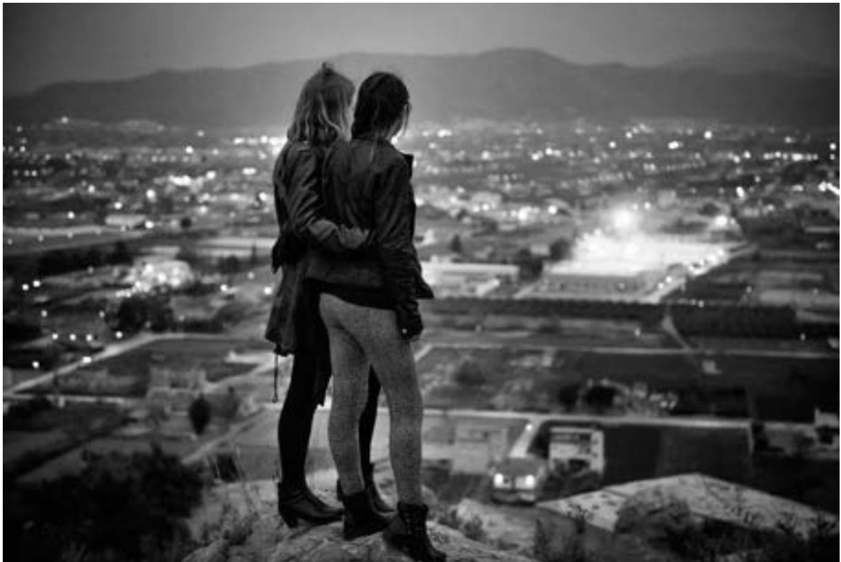
Mar Sáez. Vera y Victoria #31. Serie "Vera y Victoria", 2015. Impresión de tintas pigmentadas sobre papel estucado de calidad artística.

La iluminación excesiva de las ciudades (y la contaminación lumínica derivada), el uso de cada vez más electrodomésticos y sobre todo la calefacción en invierno y la climatización en verano, además del consumo de agua caliente, son los principales gastos en los que se puede incidir más fácilmente para seguir fomentando, como se ha venido haciendo, el ahorro energético.