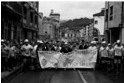
Santi Donaire. Sin título . Serie "The last miners". Impresión de tintas pigmentadas sobre papel de algodón