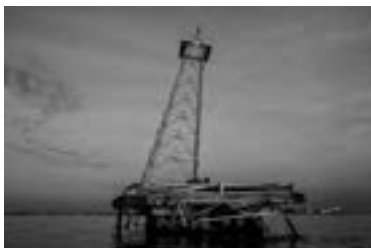
Santi Donaire. Sin título. Serie "Crude". Impresión de tintas pigmentadas sobre papel de algodón