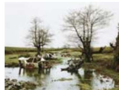
Eric Baudelaire. Plantation . Serie "Espacios Imaginados", 2004. C-Printsiliconada sobre aluminio.