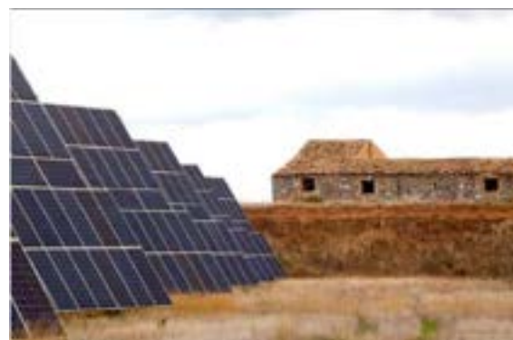
Ignacio Evangelista. Tres capas de paisaje. 2010. Copia Digital C-Type