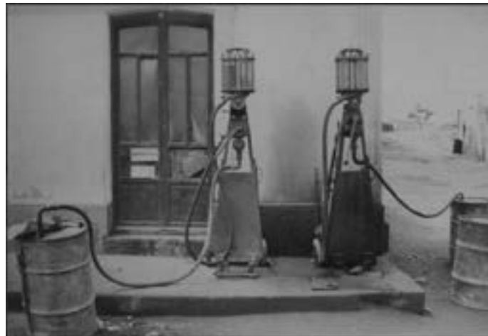
Ramón Masats. Cabo de Gata, 1961. Serie "Petróleo", 1965. Gelatina de plata sobre papel.

Para alcanzar la neutralidad climática en 2050, es preciso transformar y adaptar la industria y la producción de energía . En España, la Ley de Cambio Climático (7/2021, de 20 de mayo) promueve la economía circular para 2030, una sociedad sostenible, descarbonizada y eficiente en el uso de recursos, además de competitiva.