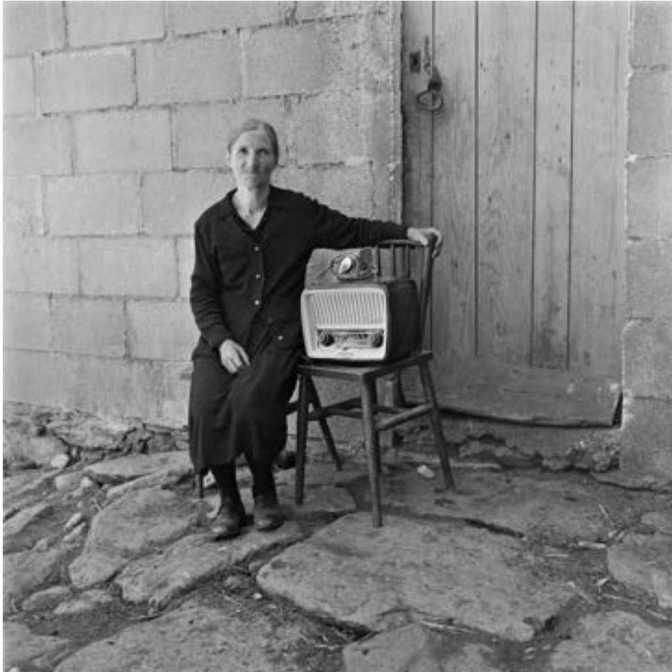
Virgilio Viéitez. Dorotea do Cará , 1962. Gelatina de bromuro de plata virado al selenio sobre papel baritado.

El "punto óptimo" a alcanzar a nivel global consistiría en un equilibrio necesario entre la calidad de vida (de la que carecen los países empobrecidos) con relación al respeto ambiental (que no abunda en los países más ricos) y la eco-dependencia.